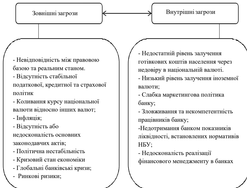
Рис. 1. Загрози для банківської сфери України в сучасних умовах

- фінансова стабільність. Важливою задачею є підтримка стабільності національної валюти та забезпечення довіри до банківської системи з боку населення та інвесторів.